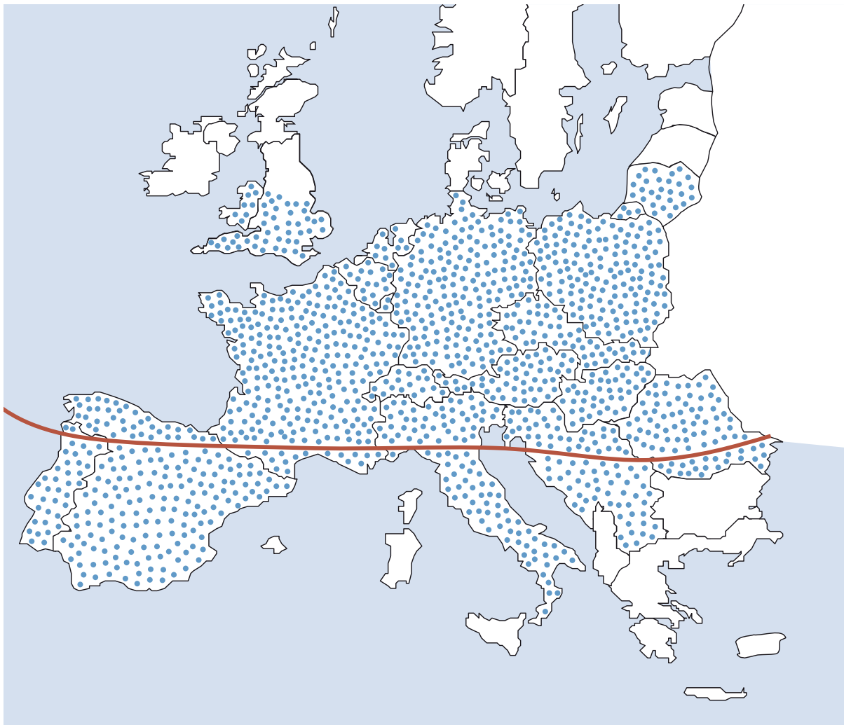
Abbildung 2b: Verbreitungsgebiet von Dermacentor reticulatus in Europa (Vorkommen in allen gepunkteten Regionen, jedoch bevorzugt oberhalb der roten Linie)

während des Saugakts über den Speichel übertragen werden oder im Fall von Hepatozoon spp. nach oraler Aufnahme der Zecke durch den Wirt.