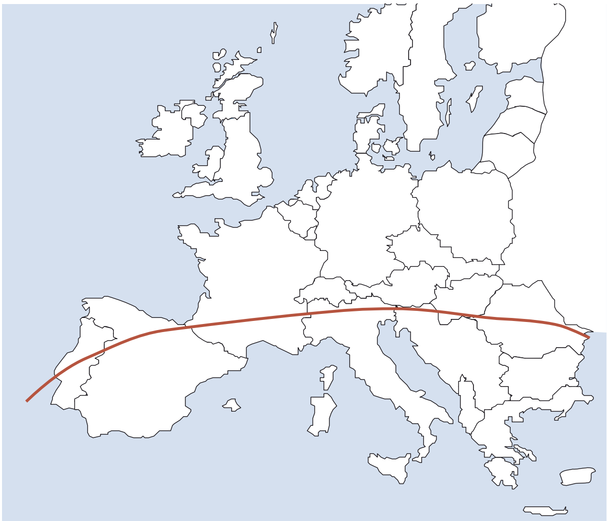
Abbildung 2a: Verbreitungsgebiet von Rhipicephalus sanguineus , die ursprünglich eine südeuropäische Zecke ist (unterhalb der roten Linie häufigeres Vorkommen)

Zecken sind Parasiten, die temporär Blut saugen und sich unterschiedlich lange auf ihren Wirten aufhalten. Bei Schildzecken dauert der Saugakt je nach Entwicklungsstadium 2-10 Tage. Klinisch betrachtet sind Zecken vor allem als Vektoren für Protozoen, Bakterien und Viren von Bedeutung, die von der Zeckenart und dem geografischen Standort abhängt (Tabelle 4). Infektionen können