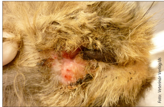
Harträchtige Pilzinfektion bei einer Perserkatze – Katzen von Züchtern sind nicht zwingend gesünder als solche aus dem Tierheim.

Coronaviren, Calciviren, FIP oder Giardien – ein nicht unbe-trächtlicher Anteil der Katzen, die im Alter von unter einem Jahr beim Tierarzt vorgestellt werden, ist krank. Dabei sind Tiere von »Züchtern« nur wenig gesünder als Tierheimkatzen. Gibt dies Aufschluss über die Zustände in Katzenzuchten? Und wie können Kunde und Katze geschützt werden?