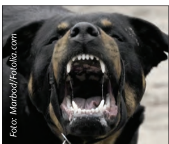
Bösartig oder abwehribereit.