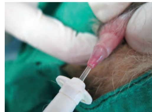
Streitpunkt Penisspülung beim Kater: Was darf der Eingriff kosten?