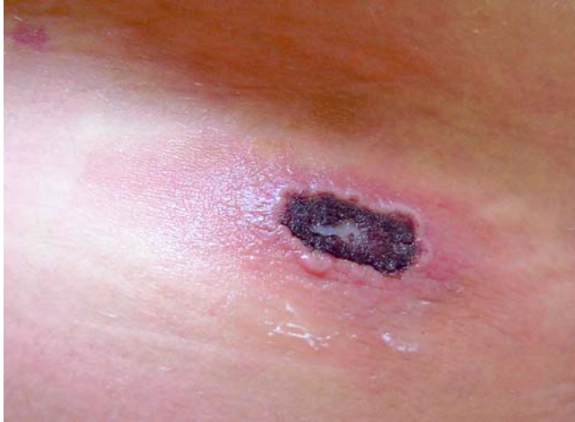
Typisches Bild einer Kuhpockenläsion beim Menschen